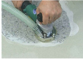
●ウレタン塗膜の除去