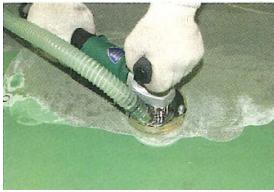
●エポキシ塗膜の除去